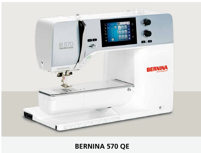
BERNINA 570 QE