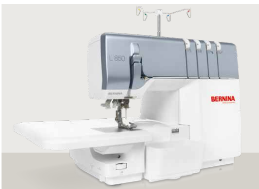
BERNINA L 850