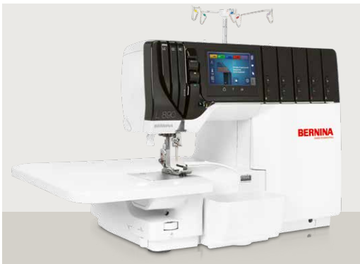
BERNINA L 890