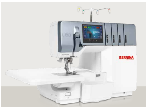
BERNINA L 860