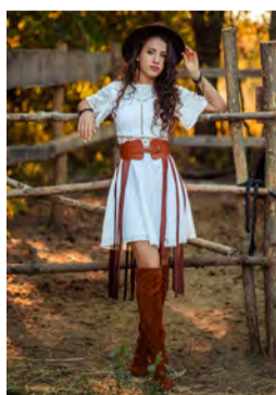
Lange Fransen als Accessoire