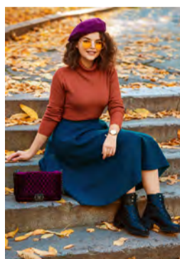
Midi-Rock und trendige Baskenmütze