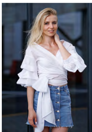
Bluse mit Volants und Denim-Jupe

Stoffe, Bänder, Accessoires für Ihre eigenen Kreationen erhalten Sie, ebenso wie superweiche Merinowolle bei nadel-art. in Dielsdorf.