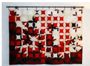
Workshop Atarashii (Japanisches Patchwork)