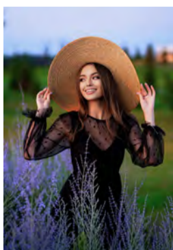
Transparente Bereiche oder Cut-Outs